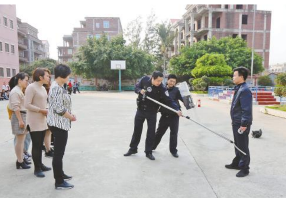
为提升校园反恐袭击应急处置能力,近日,北岸山亭镇政府联合忠门派出所,在山亭西埔口小学开展反恐应急演练。

秀屿区开展读书月系列活动。连日来,秀屿区开展以“花季港城·书香校园”为主题的读书月系列活动。全区5万多名学生积极参与到读书活动中来,使阅读成为一种学习习惯和新的风尚,让花香和书香弥漫校园。4月10日,秀屿区实验小学举行以“书香童年·激越梦想”为主题的第八届校园读书节启动仪式。活动中,该校学生还带来了精彩的小品和集体经典诵读表演,博得了阵阵掌声,让人感受到了中华经典风韵的魅力。4月11日,笏石中心小学举行以“进入新时代·改革开新篇”为主题的讲故事比赛。来自该中心小学基层学校21名优秀学生讲述改革开放以来各行各业涌现的榜样人物典型事迹,分享成长路上的所见所闻所感。当天,月塘中心小学举行第26届全国爱国主义读书活动暨讲故事比赛,表达对民族英雄与革命先烈的敬仰。(刘金通 吴秀妹)