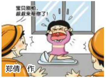
消防员提醒,公共场所、幼儿园、家里的厕所要注意保持整洁,有积水时要及时清理,以防幼儿滑倒等类似情况发生。郑倩 作

本报讯(记者吴伟锋 通讯员卓丽双)女童脚被卡在便池里,无法拔出。城厢消防中队消防员立即赶到现场,对便池进行破拆,救出该女童。近日晚7时许,城厢消防中队接到一起求助报警后,派出消防员赶往现场处置。女童右脚掌被卡在便池内,疼痛地哭喊。消防员一边安抚女童情绪,一边给她的脚腕腿部做好防护措施,试图将其脚拔出,但没有成功。随后,消防员利用手动破拆工具,一点点将便池破拆,经过10分钟的努力,将被困女童解救。经检查,女童被卡的脚掌只是轻微擦伤,并无大碍。消防员提醒,公共场所、幼儿园、家里的厕所要注意保持整洁,有积水时要及时清理,以防幼儿滑倒等类似情况发生。