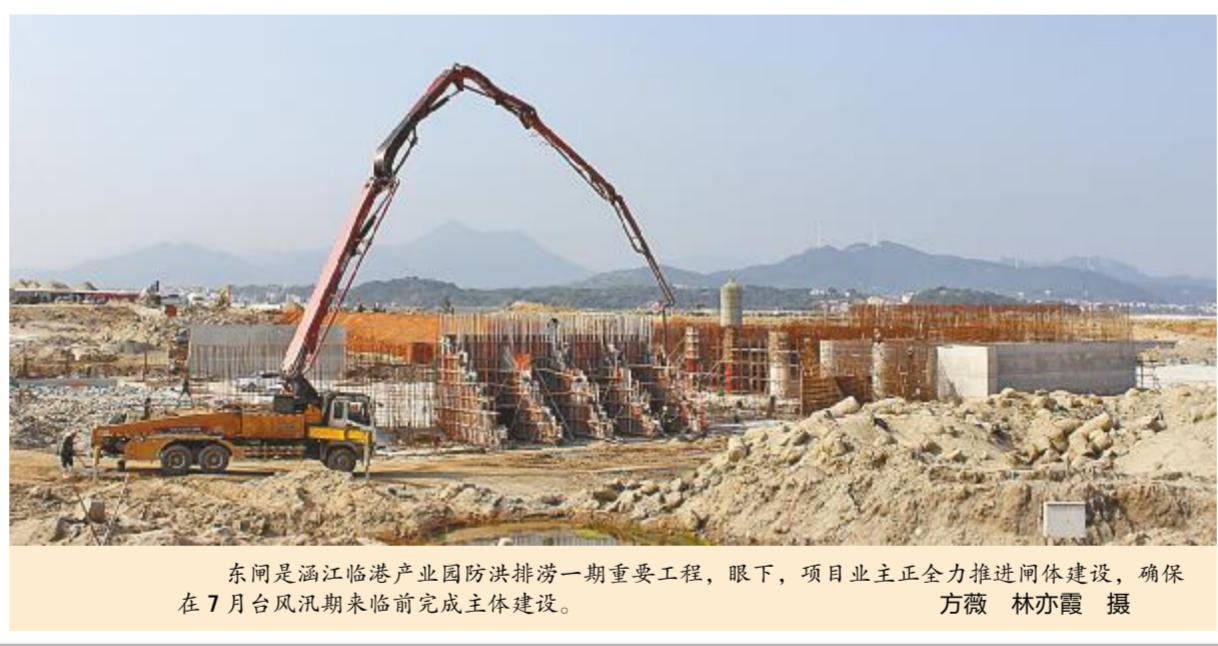
东间是涵江临港产业园防洪排涝一期重要工程,眼下,项目业主正全力推进闸体建设,确保在7月台风汛期来临前完成主体建设。

路、园林等地,进行不间断巡查,及时消除安全隐患。 近段时间,为防止强降雨可能造成的堤坝水毁、山体滑坡等地质灾害,涵江区组织开展防汛备汛安全大检查,围绕城区易涝点、地质灾害点、低洼地、危旧房等高风险区,以及海堤、水库等重点防御部位,排查整治隐患,建立问题清单、整治台账。并优先安排专项水利资金,开展梧梓河等河塘清淤整治、水毁灾损修复等,提高河道的疏浚排洪能力。 除了修复水毁工程,加固堤防,该区组建了15支防汛抢险队伍,落实24小时防汛值班和领导带班制度,密切注视雨情、水情,完善应急预案,确保人民生命财产安全。(朱秀花 林亦霞)