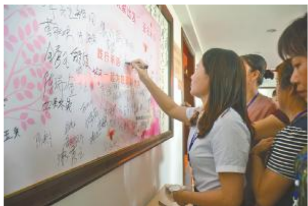
荔城区开展“树清廉家风、创最美家庭”活动,筑起反腐倡廉的家庭防线。图为近日,黄石镇惠下村“风清气正,从家出发”签名承诺仪式现场。

本报讯(记者 郑巴东)昨日,我市首场公车改革处置车辆拍卖会举行,共拍出公车28辆。 据了解,本次拍卖共推出86辆公车,车型涵盖多个品牌的轿车、客车等,车辆登记日期集中在2001至2011年。最低起拍价为5200元,采用增价拍卖方式,根据车辆起拍价不同,每次加价幅度也不同。 当日,竞拍现场热闹非凡。经过多轮举牌竞价,一辆起拍价20300元的黑色雅阁轿车,被林女士以31500元价格竞得,成为首场拍卖成交的公车。当天拍卖会起拍价最高的一辆2010年登记上牌的黑奥奥迪轿车,起拍价为11.5万元,最终以12万元成交。 下一场公车拍卖将于6月8日举行,计划拍卖公车81辆。